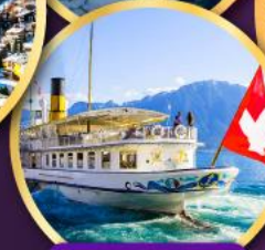
ล่องเรือทะเลสาบเจนีวา