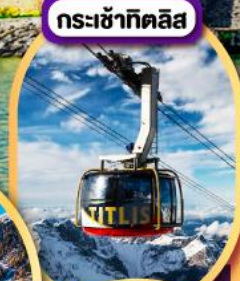
กระเช้าทิตลิส