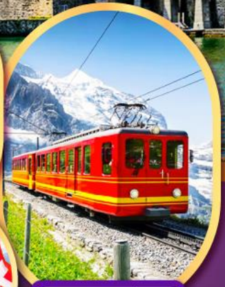
รถไฟสู่ยอดเขาจุงเฟรา