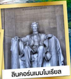
ลินคอล์นเมมโมเรียล