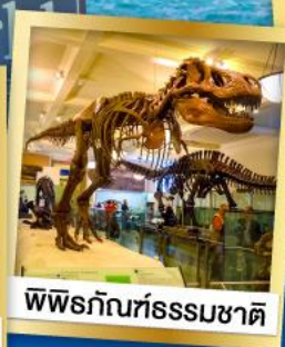
พิพิธภัณฑ์ธรรมชาติ