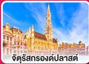
จัตุรัสกรองด์ปลาสต์