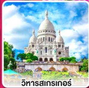
วิหารสกรเกอร์

อร่อยกับเมนู หอยแมงกุ่มอบไวน์ขาว หอยเอสคาโก, ทาหมูเยอรมัน