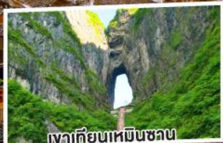
เงาเทียนเหมินชวน