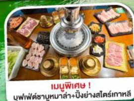
เมนูพิเศษ!