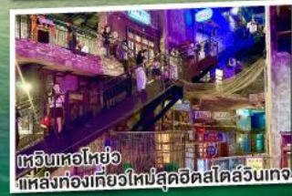
เหมือนหอไอซ์