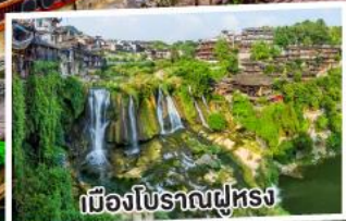
เมืองโบราณฟู่หลง