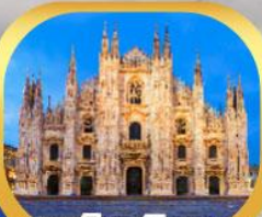
มหาวิหารมิลาน