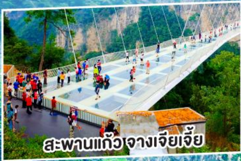
สะพานแก้วจางเจียเจีย