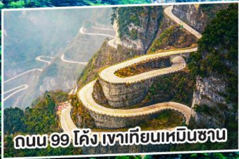
ถนน 99 โค้ง เหวเทียนเหมินซาน