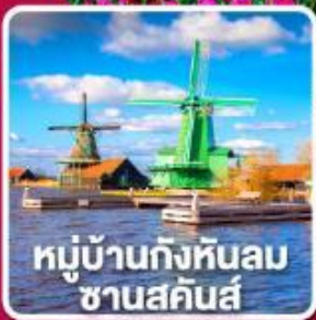
หมู่บ้านกังหันลม ชาบสคินส์