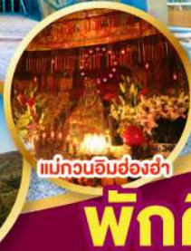
แม่กวนอิมฮ่องกง