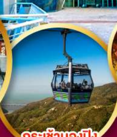
กระเช้านองปิง