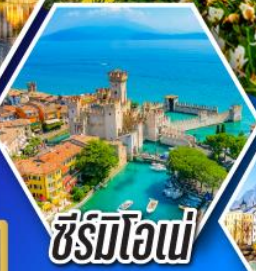
ซีร์มิโอเน่