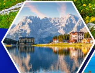
ทะเลสาบมิสุร์น่า