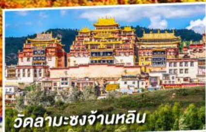
วัดลามะจงจ้านหลิน