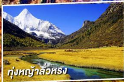
ทุ่งหญ้าลั่วหลง

เที่ยว 2 ภูเขาหิมะศักดิ์สิทธิ์ไปห่ม่า และ ภูเขาหิมะเหมยลี่ ชมใบไม้เปลี่ยนสี ณ อุทยานย่าติง (ไม่ลงร้านช้อปปิ้ง + ไม่จ่ายออฟชั่น)