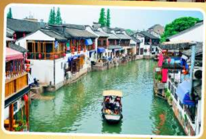
เมืองโบราณจู่เจียเจี้ยว