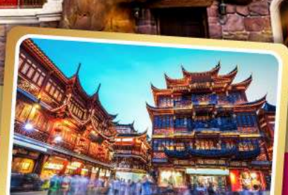
ตลาดร้อยปีฉงหวงเมี่ยว