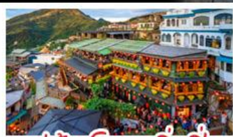
หมู่บ้านโบราณจิ่วเฟิ่น