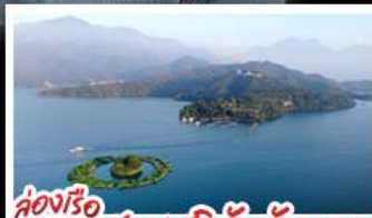
ส่องเรือทะเลสาบสุริยันจันทรา