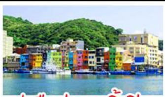
ทำเรือประมงเจิ้งปิ่น

รถไฟสายโบราณอาลีซาน - ตึกไทเป 101 ประมงเจิ้งปิ่น - จิวเฟิ่น - ล่องเรือทะเลสาบสุริยันจันทรา ถนนเมมูเค็ด เสี่ยวหลงเป่า & ปลายประธาราธิบดี ช้อปปิ้ง 3 ย่านดัง : ซีเหมินดิง - ไถจงไนท์มาร์เก็ต - MITSUI OUTLET