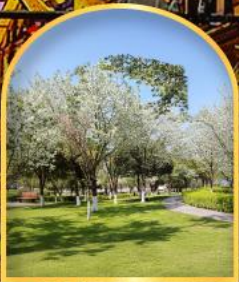
ชมดอกซากุระ ณ สวนจงยาง