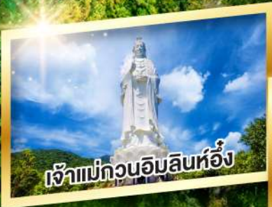
เจ้าแม่กวนอิมสินห์อั้ง