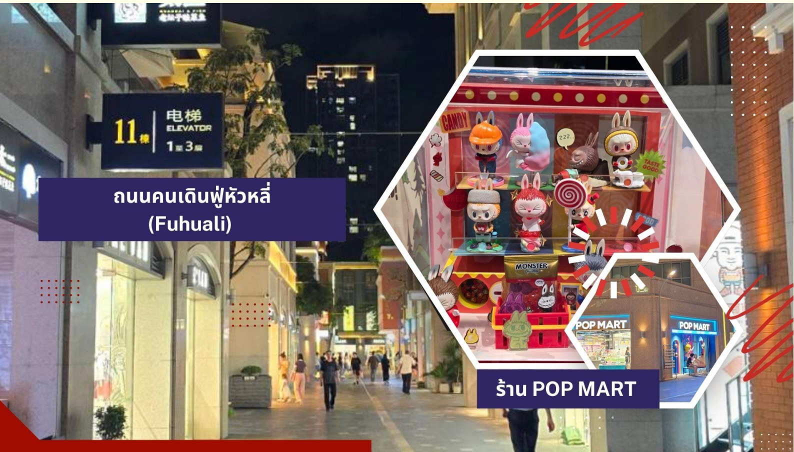
ถนนคนเดินฟู่หวู่หลี่ (Fuhuali)

ลงทุนก่อสร้างไปมากกว่า 1,008 ล้านบาท โดยได้รับการออกแบบเป็นรูปทรงเปลือกหอยฝาประกบกัน 2 อัน ที่ดูกิ่งโปร่งใสในตอนกลางวัน และดูใสราวกับแสงจันทร์ในยามค่ำคืน ซึ่งด้วยเหตุนี้จึงเป็นที่มาให้กับชื่อเรียกของเปลือกหอยอันเล็กกว่า “เปลือกหอยดวงจันทร์” โดยเป็นโรงละครที่สามารถรองรับผู้เข้าชมได้ 500 คน และเปลือกหอยอันใหญ่กว่า “เปลือกหอยดวงอาทิตย์” ซึ่งเป็นโรงละครขนาดใหญ่ที่สามารถรองรับผู้เข้าชมได้มากถึง 1,600 คน และสามารถตอบสนองความต้องการด้านดนตรีขนาดใหญ่ ทั้งละครเพลง บัลเลต์ ซิมโฟนี และการแสดงสุดอลังการได้มากมาย จากนั้นนำท่านเดินทางสู่ ร้านหยก