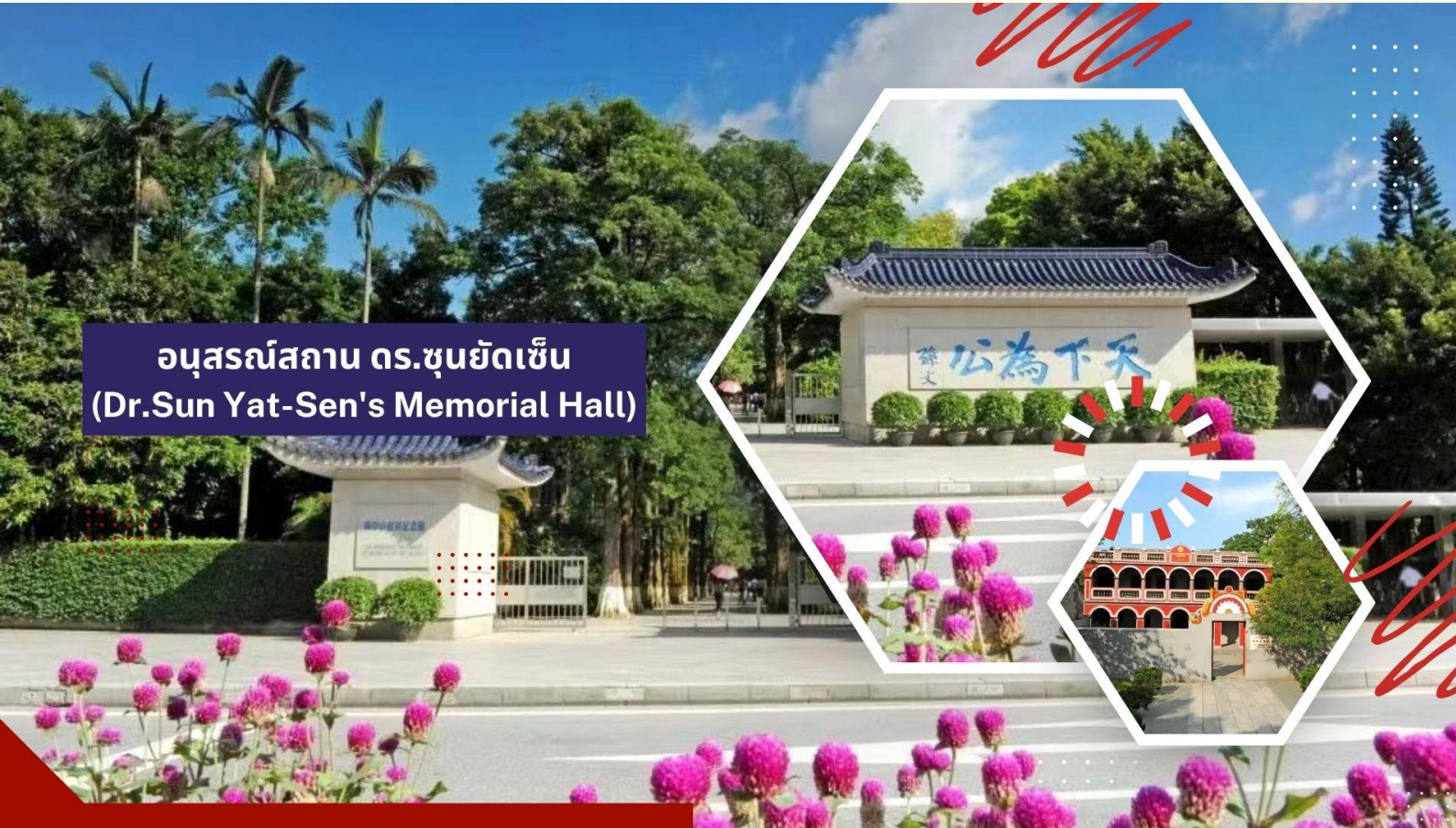
อนุสรณ์สถาน ดร.ซุนยัตเซ็น (Dr.Sun Yat-Sen's Memorial Hall)

รับประทานอาหารเช้า ณ ห้องอาหารของโรงแรม (มื้อที่ 2)