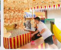
เล่นเกมสล็อตรางวัล