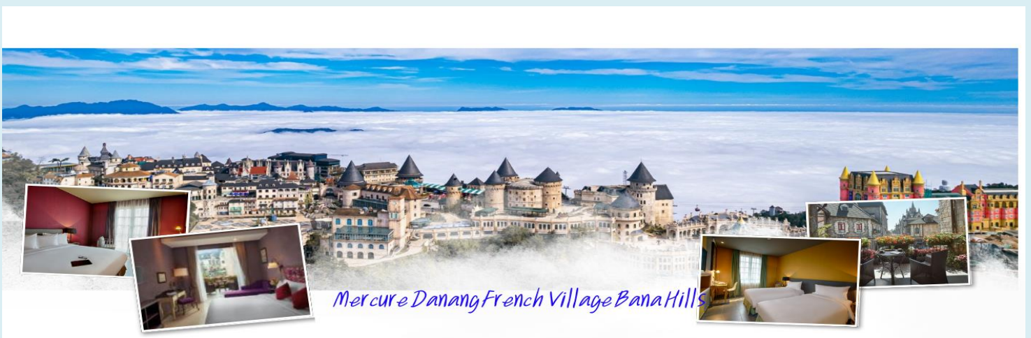
Mercuré Danang French Village Bana Hills

นำท่าน นั่งกระเช้าขึ้นสู่บานาฮิลล์ สัมผัสประสบการณ์ที่น่าตื่นเต้นพร้อมชมความสวยงามมากของธรรมชาติวิวมุมสูง บานาฮิลล์ตั้งอยู่ในจังหวัดดานัง ประเทศเวียดนาม เป็นสถานที่ท่องเที่ยวที่มีชื่อเสียงและยอดนิยมนับเป็นอย่างมาก และตัวกระเช้าลอยฟ้าเองยังมีความยาวที่สุดในโลกที่เชื่อมระหว่างเทือกเขาและยอดเขาอีกด้วย เมื่อท่านนั่งกระเช้าชมวิวทิวทัศน์ที่สวยงามของภูเขาและป่าไม้ในระหว่างการเดินทาง นอกจากนี้บานาฮิลล์ยังมีสถานที่ท่องเที่ยวที่น่าสนใจมากมาย เช่น สะพานทอง (Golden Bridge) ที่มีลักษณะเป็นสะพานที่ถูกถือโดยมือยักษ์ รวมถึงสวนสนุกและรีสอร์ทต่างๆ ที่มีบรรยากาศสุดแสนโรแมนติก