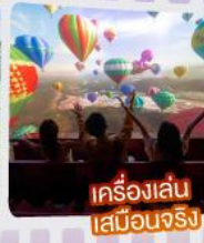
เครื่องบินเสมือนจริง