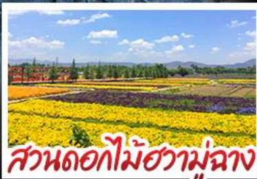
สวนดอกไม้ฮวาบูฉาง