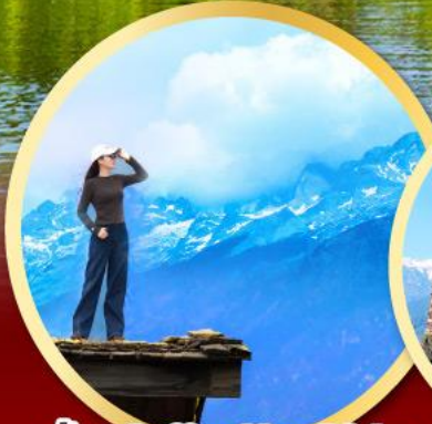
ร้าน Coffee Yun Di An