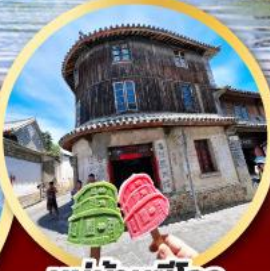
หมู่บ้านซีโจว ไอติมซีโจว