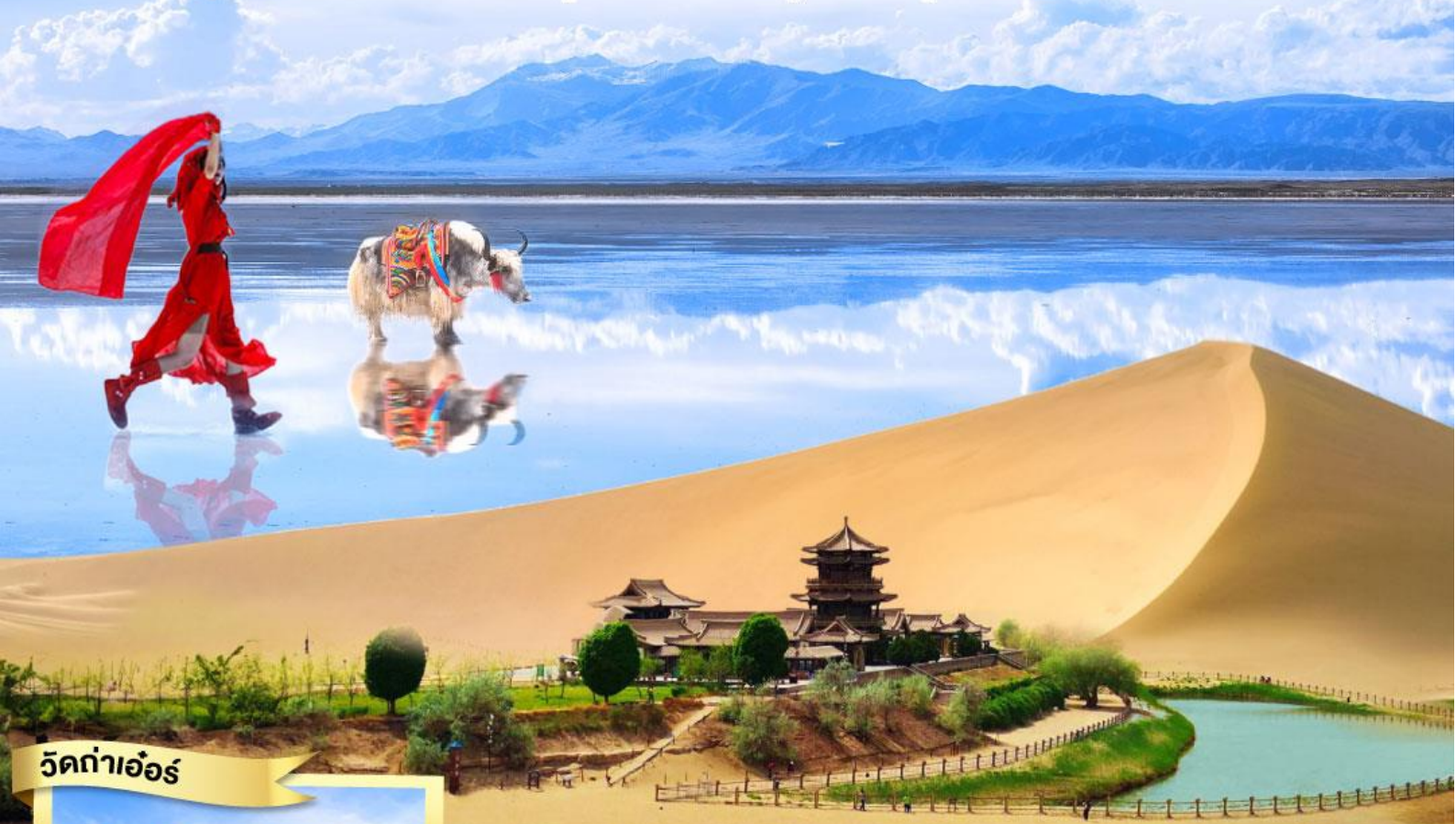
วัดท่าเออร์

มรดกโลกสองมณฑล ตุนหวง ถ้ำม่อเกาду เขาสายรุ้งจางเย่ ทะเลสาบจันทรเสี้ยว