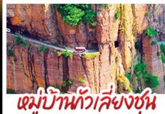
หมู่บ้านกัวลิ่งชุน