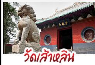
วัดส้าหลิน