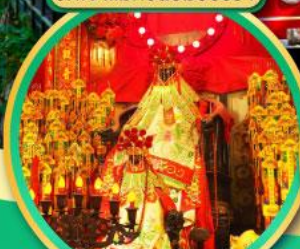
นมัสการองค์เจ้าแม่กวนอิม ที่มีอายุกว่า 600 ปี