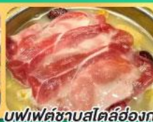
บุฟเฟ่ต์ชาบูสไตร์ฮ่องกง