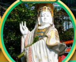
สุขภาพแข็งแรง และอายุยืน