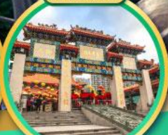
ขอพรด้านสุขภาพ