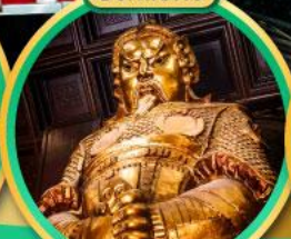
ขอพรองค์เซกง ไซคลาก การเงินและธุรกิจ