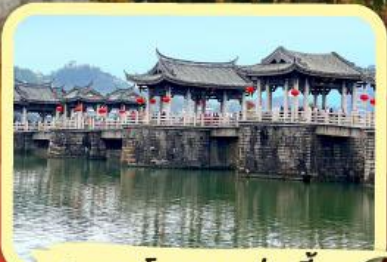
• สะพานโบราณกว้างจี้