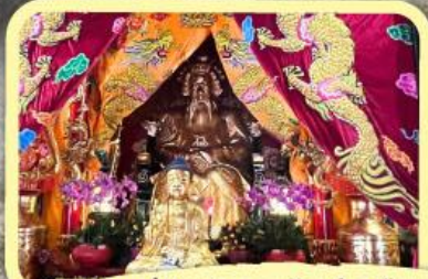
• เอียงบู๊ซัว (ศาลเจ้าพ่อเสือ)