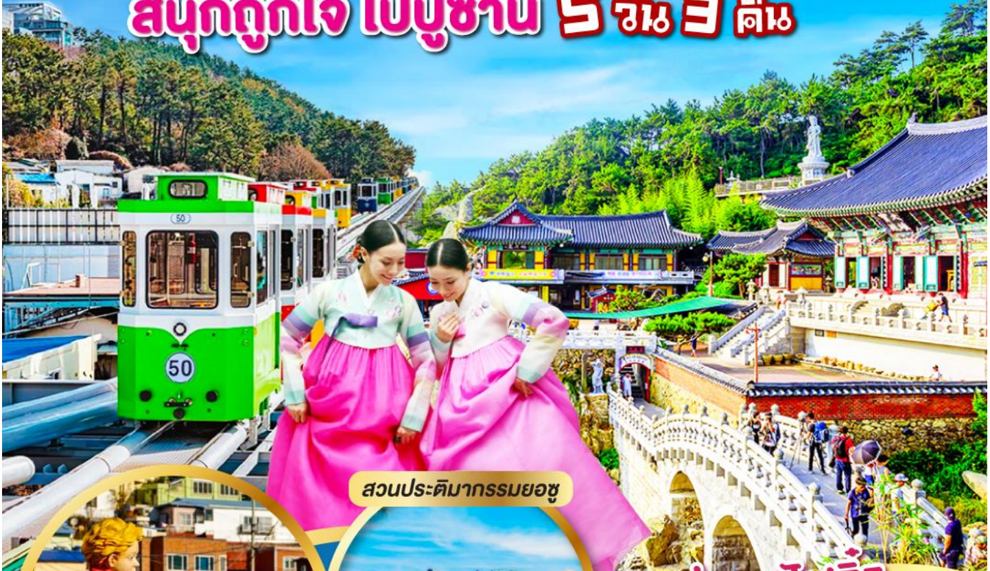
สวนประติมากรรมยอซู