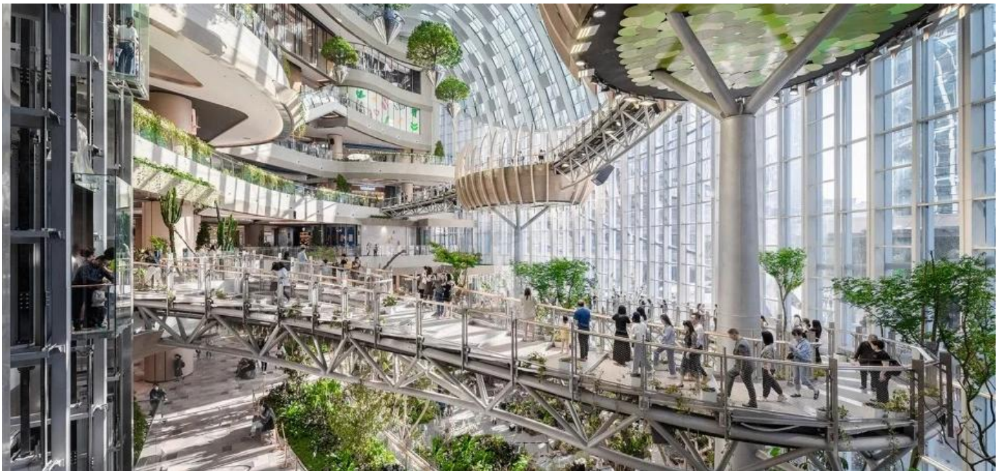
บ่าย นำท่านเช็คอิน ณ ห้าง THE RING MALL นิยามใหม่ของศูนย์การค้า ที่ซึ่งจินตนาการและความล้ำสมัยได้ก้าวไปอีกขั้น ถึงขั้นที่ท่านสามารถเดินช้อปปิ้งไปพร้อมกับการชมความยิ่งใหญ่ของธรรมชาติ หัวใจของสถานที่แห่งนี้คือ "ป่าแนวตั้งในร่มขนาดมหึมา" ที่สูงตระหง่านถึง 42 เมตรใจกลางตัวอาคาร จินตนาการถึงการเดินอยู่บนสะพานแขวนที่ทอดผ่านม่านน้ำตกซึ่งไหลลงมาจากชั้นบนสุด สองข้างทางคือพืชพรรณเขตร้อนนานาชนิดที่เขียวชอุ่มราวกับป่าดิบชื้นจริงๆ แสงธรรมชาติที่ส่องลงมาจากหลังคากระจกยิ่งทำให้ที่นี่ดู