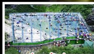
ระเบียงงักว๋ออุโมงค์