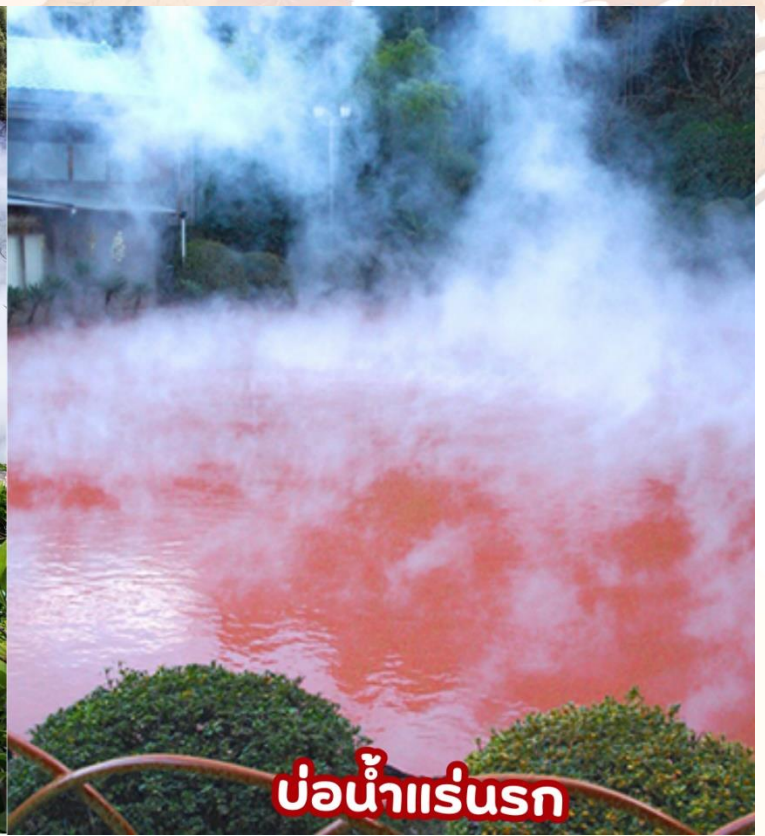
บ่อน้ำแร่บุรก

กลางวัน รับประทานอาหารกลางวัน ณ ร้านอาหาร (มื้อที่ 4)