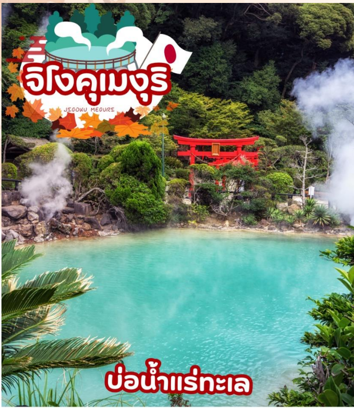
บ่อน้ำแร่ทะเล