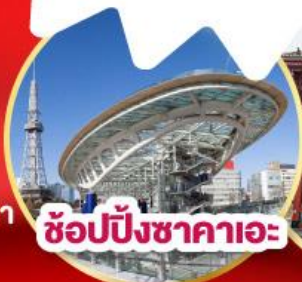
ช้อปปิ้งชาคาเอะ