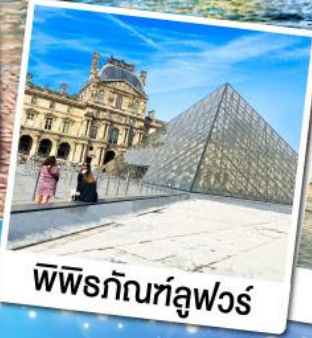
พิพิธภัณฑ์ลูฟวร์