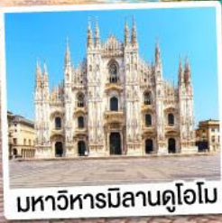
มหาวิหารมิลานดูโอโม