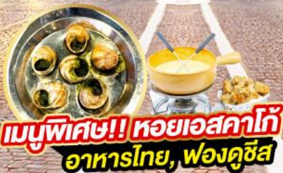
เมนูพิเศษ!! หอยเอสคาโก้ อาหารไทย, ฟองดูชีส