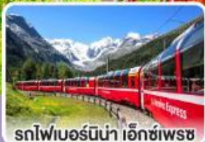
รถไฟเบอร์นินา เอ็กซ์เพรส