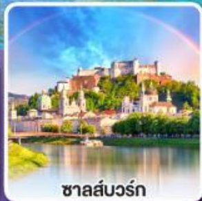
ซาลส์บวร์ก

ขึ้นรถไฟสายโรแมนติก เบอร์นินา เอ็กซ์เพรส ชมวิวตระการตาของสวิส