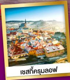
เชสท์ครุมลอฟ