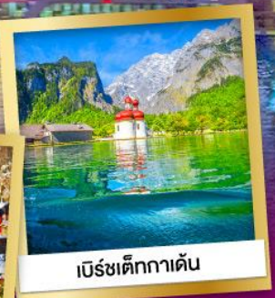
เบิร์ชเต็กกาเดิน