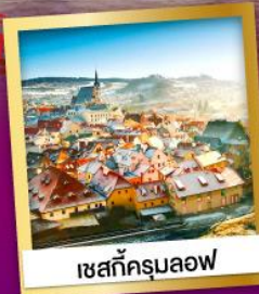
เชสท์ครุมลอฟ