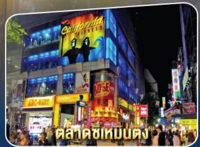
ตลาดซีเหมินตง