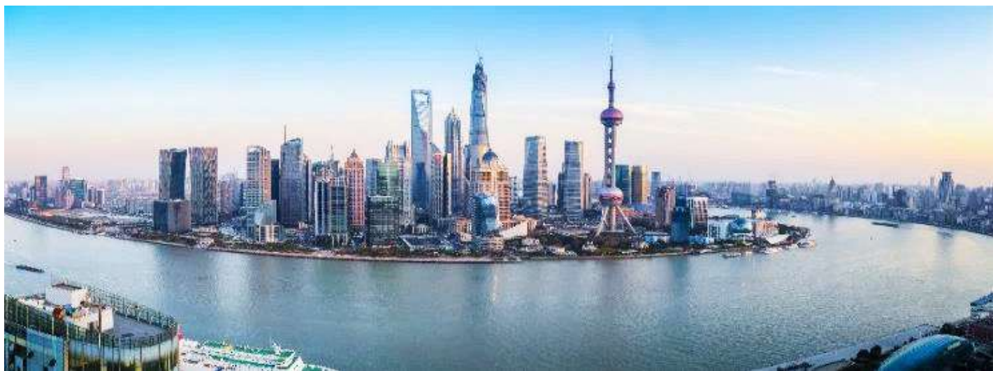
GOIPEK-CA010 มนส.ที่สุด!! ปกัก เซี่ยงไฮ้ Universal Studio Beijing + Shanghai Disneyland 6 วัน 4 คน โดยสายการบิน Air China (CA)

นำท่านสู่บริเวณ หาดไว่ทาน ตั้งอยู่บนฝั่งตะวันตกของแม่น้ำหวงผู้มีความยาวจากเหนือจรดใต้ถึง 4 กิโลเมตร ถือเป็นสัญลักษณ์ที่โดดเด่นของนครเซี่ยงไฮ้อีกทั้งถือเป็นศูนย์กลางทางการเงินการ ธนาคารที่สำคัญแห่งหนึ่งของเซี่ยงไฮ้ตลอดแนวยาวของหาดไว่ทานเป็นแหล่งรวมศิลปะ สถาปัตยกรรมที่หลากหลาย เช่น สถาปัตยกรรมแบบโรมันโกธิคबारอครวมทั้งการผสมผสาน ระหว่างสถาปัตยกรรมตะวันออก-ตะวันตกเป็นที่ตั้งของหน่วยงานภาครัฐเช่น กรมศุลกากร โรงแรม และสำนักงานใหญ่ของธนาคารต่างชาติเป็นต้น