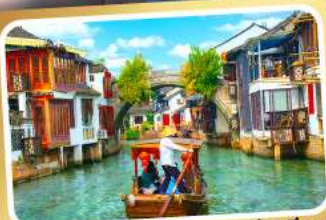
ล่องเรือเมืองโบราณซูโจวเจียเจียว