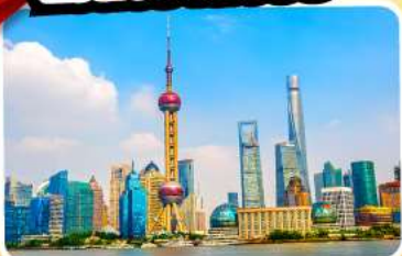
หอไข่มุก