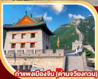
กำแพงเมืองจีน (ด่านจวิรงกวน)