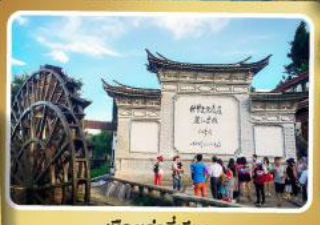
เมืองท่าลี่เจียง