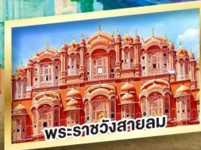
พระราชวังสลายลม