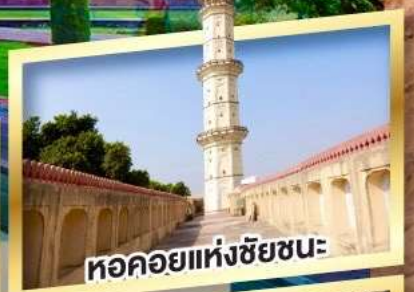
หอคอยแห่งชัยชนะ