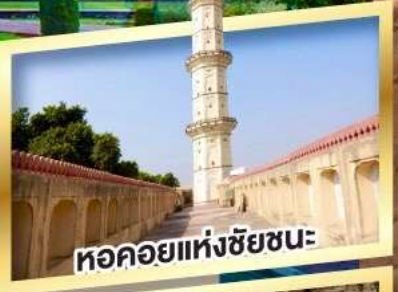
หอคอยแห่งชัยชนะ