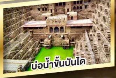
ป้อมน้ำจันทน์โด