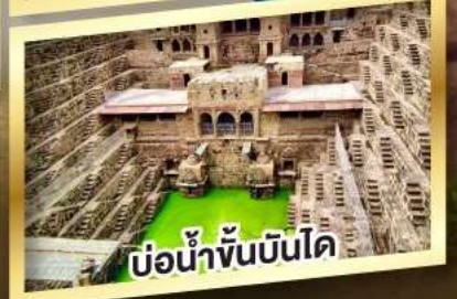
ป้อมน้ำจันทน์โด