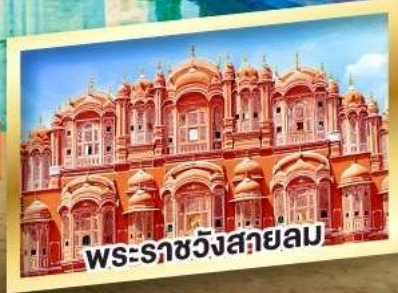
พระราชวังสลายลม