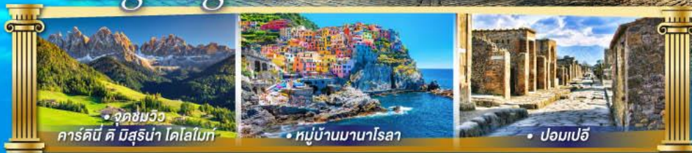
• จุดชมวิวก คาร์ดินี ดี บิสูน่า โดโลไมท์