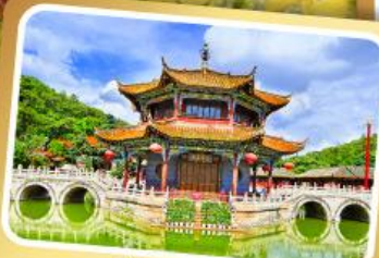
วัดฮ่องกง