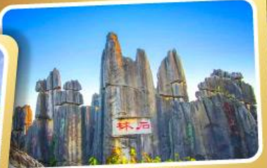
ป่าหินคุณหมิง