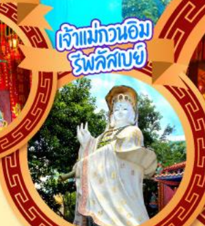
เจ้าแม่ทวนอิม วิพัสสิขย์