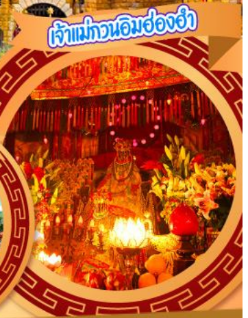
เจ้าแม่ทวนอิมฮ่องกง

05-08, 17-20 ต.ค.67 31 ต.ค.-03 พ.ย., 02-05 พ.ย.67 07-10, 14-17, 16-19 พ.ย.67 21-24 พ.ย., 28 พ.ย.-01 ธ.ค.67