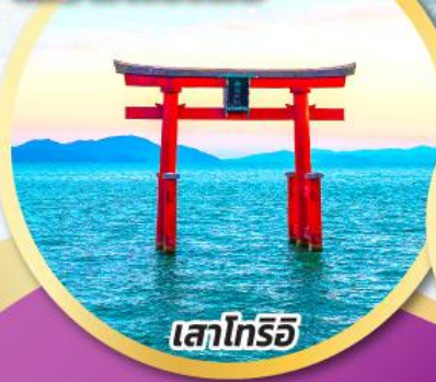
เสาโทริอิ