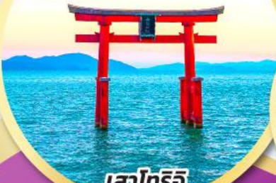
เสาโทริอิ