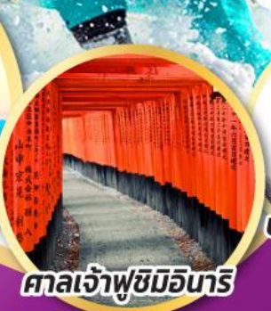
ศาลเจ้าฟูชิมิอินาริ