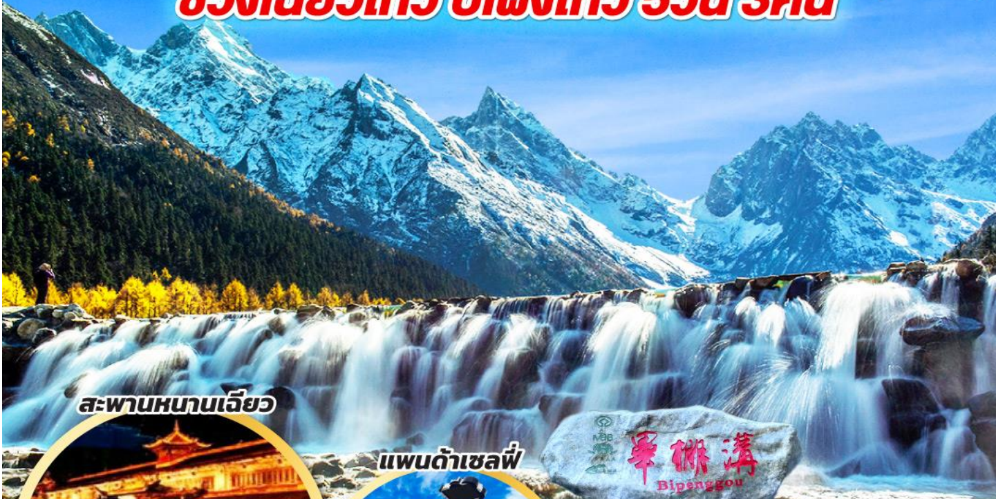
สะพานหนานเจียว

ประกันสุขภาพและอุบัติเหตุ คุ้มครองสูงสุด 3,000,000 จำนวนคุ้มครองเป็นไปตามเงื่อนไขประกัน