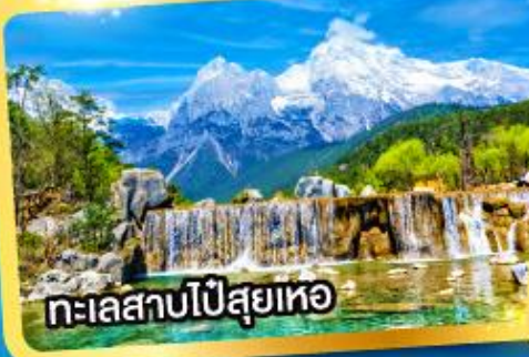
ทะเลสาบไป๋สฺยเหอ