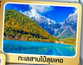
ทะเลสาบไป๋สือเหอ