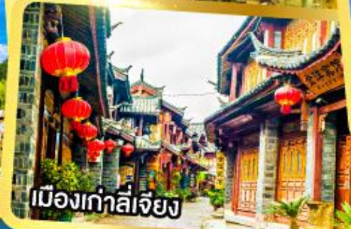
เมืองเก่าลี่เจียง