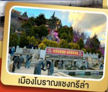
เมืองโบราณแชงกรี่ล่า