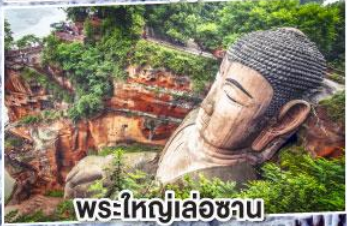
พระใหญ่เล่อซาน