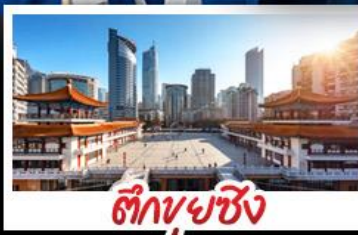
ตึกยูยชิ่ง