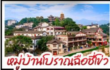
หมู่บ้านโบราณฉือชี่โจว