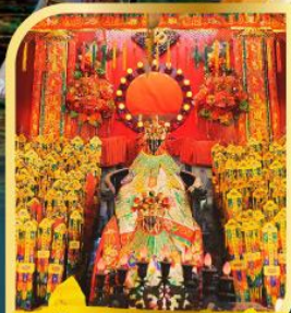
วัดเจ้าแม่กวนอิมฮ่องอ๋า