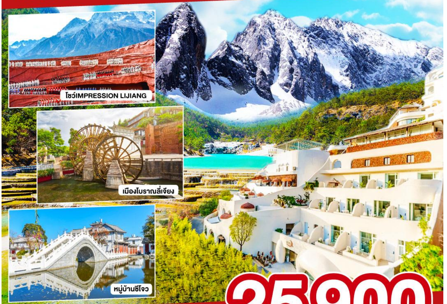
โชว์ IMPRESSION LIJIANG

ต้าหลี่ ลี่เลียง ภูเขาหิมะมังกรหยก 5 วัน 4 คืน