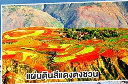
แผ่นดินสีแดงตงชวน