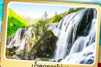
น้ำตกธารไข่มุก

ชมโชว์เปลี่ยนหน้ากาก เมนูพิเศษ สุกี้หมาลำซองวน