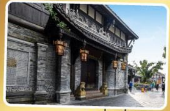
ถนนความใจ๋เซียงจื่อ