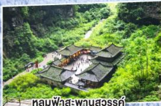
หลุมฟ้าสะพานสวรรค์