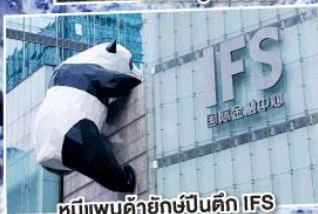
หมีแพนด้ายักษ์ปักกิ่ง IFS