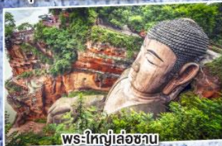
พระใหญ่เล่อซาน