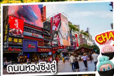
ถนนหวงชิ่งลู่