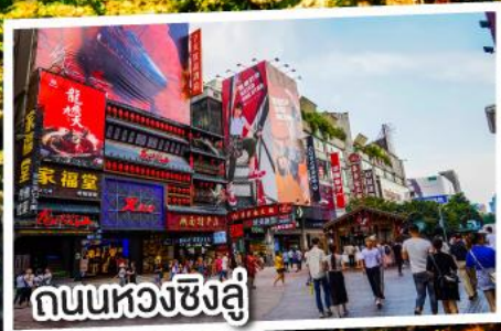
ถนนหวงซิงฉู่