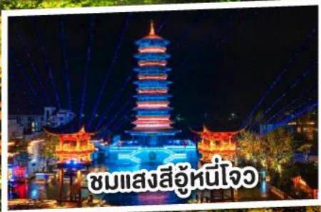
ชมแสงสีอุโมงค์ใจ