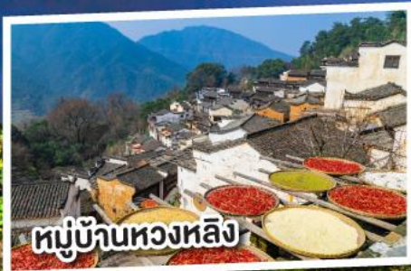
หมู่บ้านหวงหลิง