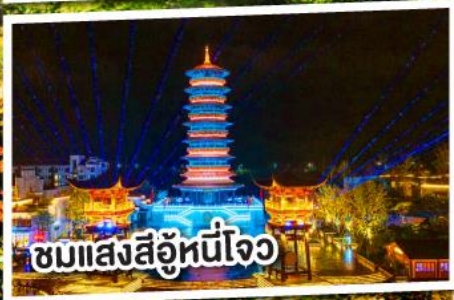
ชมแสงสีอุโมงค์ใจ