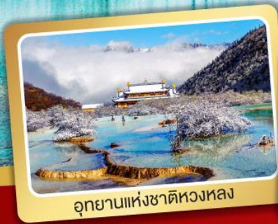
อุทยานแห่งชาติหวงหลง