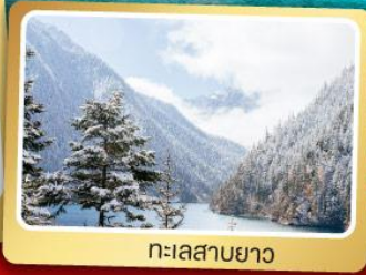
ทะเลสาบยาว