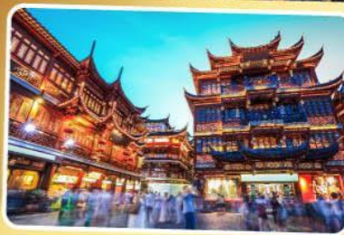
ตลาดร้อยปีเจิ้งหวังเหมียว