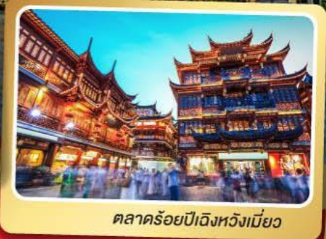
ตลาดร้อยปีฉงหวงเหมี่ยว