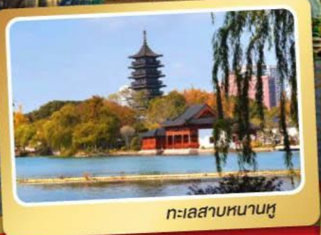
ทะเลสาบหนานหู