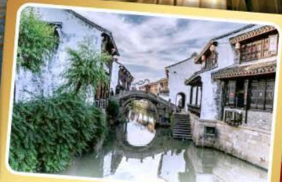
เมืองโบราณเยี่ยเหอ