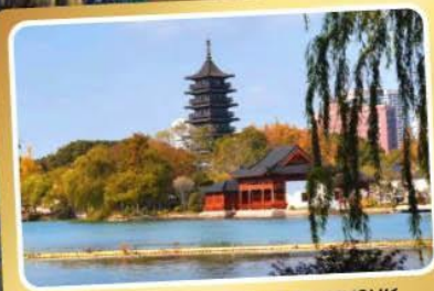
ทะเลสาบหนานหู